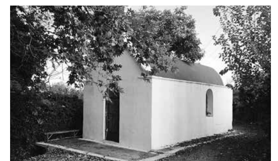
Η εκκλησία του Αγίου Κωνσταντίνου στους Αρμένους.

Κι εδά... Άστε τα δα... Απού γροϊκάς και δασκάλους και δασκαλάκια να σου λένε, για