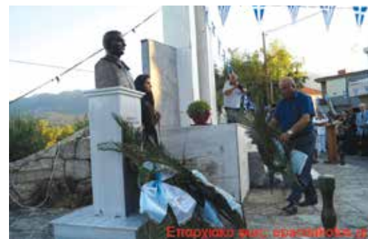
Από τα αποκαλυπτήρια της προτομής του Ιωάννη Κουρομιχελάκη

Στις 18 Αυγούστου στην πλατεία του Νίππου έγιναν τα αποκαλυπτήρια προτομής του ήρωα Ανθυπολοχαγού πεζικού [ΠΖ] Ιωάννη Κουρομιχελάκη που σκοτώθηκε ηρωικά μαχόμενος σε μια σημαντική μάχη του Ελληνικού στρατού, στις 25 Αυγούστου 1921, στην κορυφή του Καλέ Γκρότο στη Μικρά Ασία. Την εκδήλωση διοργάνωσαν ο Δήμος Αποκορώνου, η 5 η