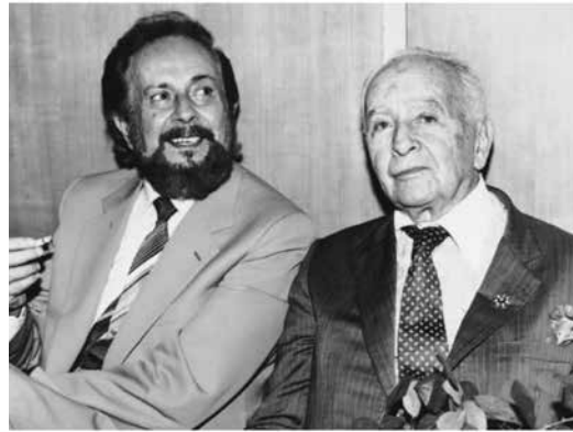
Ο Γιάννης Ρίτσος με τον Λουί Αραγκόν

αριστερό περιοδικό «Πρωτοπόροι» και τον «Ριζοσπάστη», ενώ η καταστολή των εργατικών διαδηλώσεων στη Θεσσαλονίκη τον οδηγεί στην έκδοση του γνωστού « Επιτάφιου » το 1936. Η δικτατορία της 4 ης Αυγούστου ρίχνει στην πυρά αντίτυπα του « Επιτάφιου » και η Κατοχή θα τον βρει,