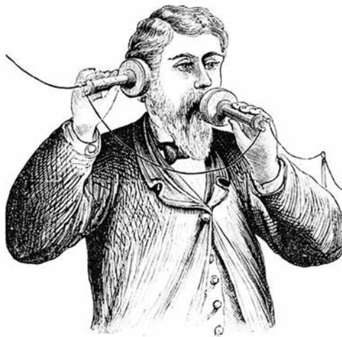
Γκράχαμ Μπελ, ο εφευρέτης του τηλεφώνου.

Μωρ' ας βάλω μπρος κι ο Γιαραμπής βοηθός, λέω τ'απατού μου, και ξεκινώ. Και αντίζ να κάμω, σα να πουμε αγιασμό του μηχανήματος, πιάνω και παίρνω τον Αρχιμαντρίτη τ'ενορίας μας και του γυρεύω του γέροντα –μ' ούλο το σέβας βέβαια που απαιτεί το αξίωμα κι η ηλικία του– να πάω από βραδίς να με ξομολογήσει και να μου συγχωρέσει κρίματα, ανομήματα και τζαγγουρνομαθήματα με τη Σοφουλιά για νάμαι καθαρός την Κυριακή που θα με μεταλάβαινε.