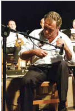
Οι οργανοπαίκτες (μέρος της ορχήστρας)