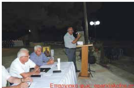
Από τα Ειρηναία 2019

Στις 22 Αυγούστου το απόγευμα της Πέμπτης και ώρα 7.30 μ.μ. ο Σύλλογος των Παιδοχωριανών Αττικής, το κοινωφελές Ίδρυμα Αγία Σοφία, ο Δήμος Αποκορώνου και η Ομοσπονδία Αποκορώνου πραγματοποίησαν τα Ειρηναία 2019 στο Νεροχώρι, χωριό του Μακαριστού Ειρηναίου Γαλανάκη. Μετά τον εσπερινό έγινε η εκδήλωση -αφιέρωμα- στα 40 χρόνια προσφοράς του Κοινωφελούς Ιδρύματος με κεντρικό ομιλητή το δάσκαλο και ταμιά του Ιδρύματος κ. Πέτρο Πανηγυράκη. Χαιρετισμό απεύθυναν οι διοργανωτές: από το Δήμο ο Δήμαρχος κ. Χαράλαμπος Κουκιανάκης, από το Σύλλογο ο κ. Παντελής Μαριακάκης, από την Ομοσπονδία ο κ. Γιάννης Τερεζάκης, ο Βουλευτής κ. Μανούσος Βολουδάκης, από την οικογένεια ο κ. Μιχάλης Γαλανάκης ανηψιός του τιμώμενου και από το Ίδρυμα ο Σεβασμιότατος κ.κ. Δαμασκηνός. Την εκδήλωση τίμησαν με την παρουσία