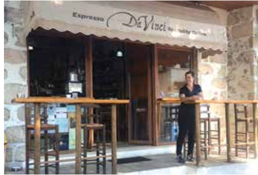
Η επιγραφή: Espresso Da Vinci!

«Αυτό ήταν», είπα μέσα μου. «Του χρόνου θα μελετήσω και τον κώδικα (Καφέ)