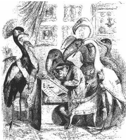
Ετσά λογής ζωντανά είχε και η «Εδέμ» του Φρηνς τ' Αμερκανου.

-«Ποιος κατέει, Αρχοντούλα μου, πως τα 'βγαλ' ο πεζεβέγκης και μ' ίντα μαχαιροβγάλτες είχε πάρε-δώσε στο "Σικάγο-Σίτυ". Χασίσια και πουτ...νες, με το συμπάθιο θάν'