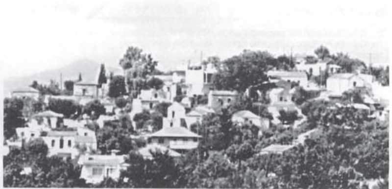
Μια άποψη από τις Κούκλες. Η νότια πλευρά

Σίγουρα δεν είναι τυχαία η τοπογραφία αυτή. Σίγουρα τ' αθάθητο αισθητικό κριτήριο των τότε απλών κατοίκων του χωριού "βάφτισε" ΚΟΥΚΛΕΣ την ξέχωρη αυτή γειτονιά. Κι ας ήταν η πιο ανηφορική και