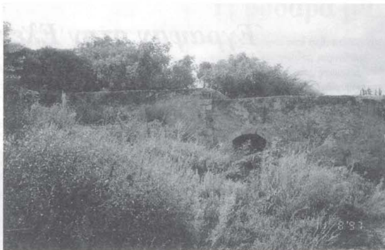
Μια άποψη από τον μισοερειπωμένο "Μύθο". Μήπως είναι καιρός να αναστηλωθεί και να αποκτήσει ένα νέο σκοπό;

• Φόρος επιβάλλεται από φέτο και στη ταικούδιά. Ειδικότερα από φέτο ο φόρος θα είναι 100 δραχμές, το 1998 150 δραχμές και το 1999 200 δραχμές και θα επιβάλλεται με την έκδοση της άδειας απόσταξης. Μή χειρότερα !!!