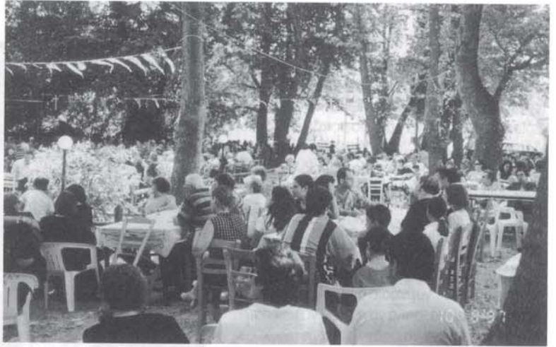
Μια άποψη του τραπέζιού κάτω από τα πλάτνια στα 'Κρύα Νερά'

Εμείς απλώς θέλουμε να πούμε ότι εντυπωσιαστήκαμε. Από την έγνοια και το μεράκι των ανθρώπων τούτων να διαφυλάξουν τις σπάνιες φυσικές ομορ-