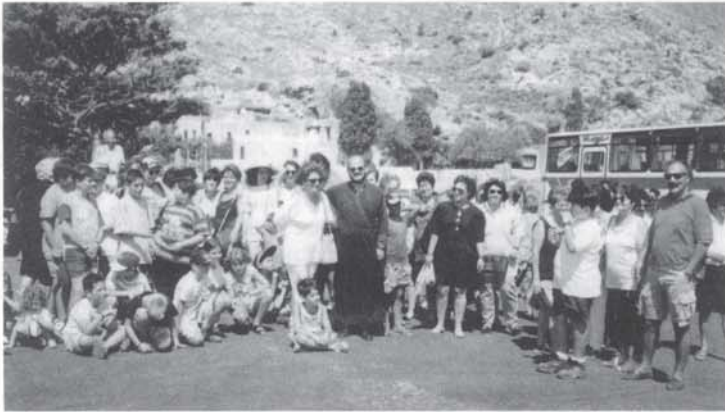
Μια παρέα Αρμενιανόι, μπροστά από τη Μονή της Πρέβελης.

Στις 8 Αυγούστου 1997 διοργανώθηκε εκδρομή των Αρμενιανών. Το δρομολόγιο περιλάμβανε τη διαδρομή Σπήλι, Μονή Πρέβελη, Πλακιά, Ρέθυμνο, επιστροφή.