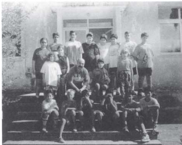
Οι χορευτές, με το δάσκαλό τους, ένα διάλειμμα των μαθημάτων.

Η Κοινότητα Αρμένων Αποκορώνου, και ο σύλλογος Αρμενιανών Αττικής ο "Κριτοβουλιδής" διοργάνωσαν μαθήματα κρητικού χορού, στο Δημοτικό Σχολείο, για τα παιδιά που βρισκόντουσαν