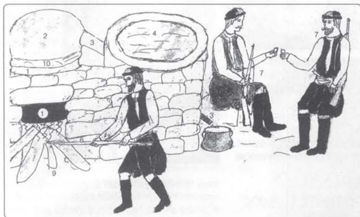
Το ρακοκάζανο (Σκίτσος από το βιβλίο του Κανάκη Γ. Γερωνομάκη, Η Κρήτη στο πρόσφατο παρελθόν)

Μετά μπαίνουν 2 κουβάδες νερό και το καζάνι σφραγίζεται. Δίπλα στο καζάνι υπάρχει ένα βαθύ δοχείο και μέσα έχει παγωμένο νερό, που μέσα του περνά μια κυκλική σωλήνα. Αυτό κάνει το τον ατμό να υγροποιείται. Σε μισή ώρα αρχίζει να βγαίνει το πρωτοράκι και χρησιμοποιείται για ιατρικούς σκοπούς. Σε λίγο βγαίνει η κανονική τσικουδιά και στο τέλος όσο τέλος χάνει τη δύναμή της. Η διαδικασία ξεκινάει από την αρχή, καθάρισμα κ.λπ.