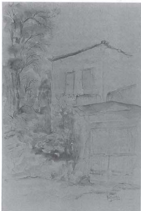
Παλιά αρμενιανή αρχιτεκτονική και σημερινή αρμενιανή ζωγραφική: Το σπίτι "το Αντρούθοκατερίνης" όπως ήταν παλιά, σχεδιασμένο από την Ολυμπία Βεζυρέα - Μαντωνανάκη.