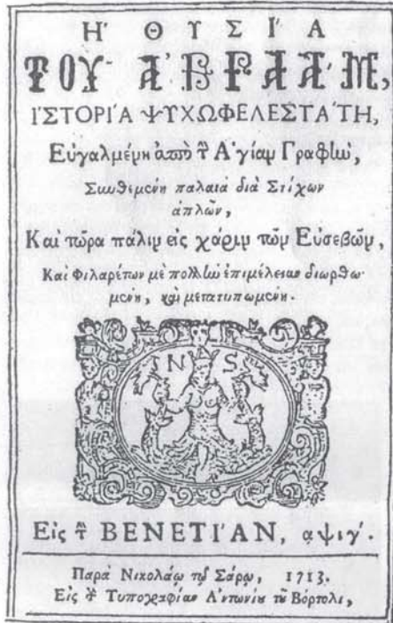
Το εξώφυλλο της πρώτης γνωστής εκδόσεως της "Θυσίας του Αβραάμ".

Της Ροδαράς τούτης τα ρόδα τα κορφολογά 'πο τα περβόλια ο ΧΑΡΑΛΑΜΠΟΣ ΕΛΕΥΘΕΡΟΠΟΛΙΤΗΣ