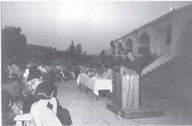
Φωτογραφία από την εκδήλωση.

τους γραμματικούς αρμενιανούς, κι η γλώσσα ντων επήγαινε ροδάκι. Μυθράλιον ήταν ο Βενιζέλος και Χρυσόστομος ο χωριανός μου υπουργός. Λίγα κατάλαβα, γιατί με τσ' αριθμούς και τσι λογαριασμούς δεν τα πολυπώω καλά εγώ η "Ελευθερόπολις". Από τη μια δραχμή που 'βαλα την τιμή του φύλλου καταλαβαίνετε δα σε ποια εποχή παλιοημερολόγιτική ζωό, κι είντα κουμάντα κάνω με τσι παράδες. Ίδια κι απαράλλαχτα με του συγχωρεμένου του Γιωργάκη του Κουκουράκη τα εμπόρια. Απού τα καρόλια τση κλωστής, τσ' "Αγκυρας", που τα 'χε αγορασμένα, πριν τον πόλεμο του '40, μια δραχμή κι ενενήντα λεφτά, τα πουλίε στην κατοχή δύο δραχμές, την ίδια ώρα που στη Χώρα τα πουλούσανε οι εμπόροι είκοσι χιλιάδες δραχμές τ'να. Κι έπαιξε βέβαια φαλιμέντο η επιχείρηση του Γιωργάκη. Μα κι εμένα τσελεκωμένο και στο καροκόλι θα μ'είχανε κλεισμένο από καιρό για τα χρέη, αν δεν εκάναν ρεφενέ οι αναγνώστες να μ'αγοράζουν το χαρτί, και να πλερώνουν τον τυπογράφο και τον ταχυδρόμο.