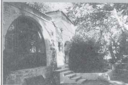
Ο πλάτανος μετά τη δεύτερη επίθεση που δέχτηκε κημιένη να αντιστέκεται και να πετά νέους βλαστούς

Γράψαμε στο προηγούμενο φύλλο, για την καταστροφή που βρήκε τον ιστορικό πλάτανο του χωριού μας από τους δυνατούς νοτιάδες τον Απρίλη. Δυστυχώς κάποιοι ζήλεσαν την δόξα του Νοτιά και θέλησαν να συνεχίσουν το έργο του, το πρώτο δεκάημερο του Ιουλίου και σε ότι είχε απομείνει, του έβαλαν φωτιά από την πλευρά της κουφάλας. Για