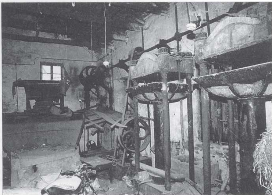
Το εσωτερικό του αλετριβιδιού του Αγγελή, όπως είναι σήμερα. Ο Σύλλογός μας συζήτησε με τους κληρονόμους της οικογένειας Αγγελάκη, την αξιοποίηση του ελαιοτριβείου και την μετατροπή του σε Μουσείο - Πολιτιστικό κέντρο. Η συζήτηση βρίσκεται σε καλό δρόμο, αλλά οι δυσκολίες είναι ακόμα πολλές.

Από τις σημειώσεις του αείμνηστου Μιχαήλ Λάμπρου Τερεζάκη (1912-1983), Εκάλη, Ιούλιος του 1976.