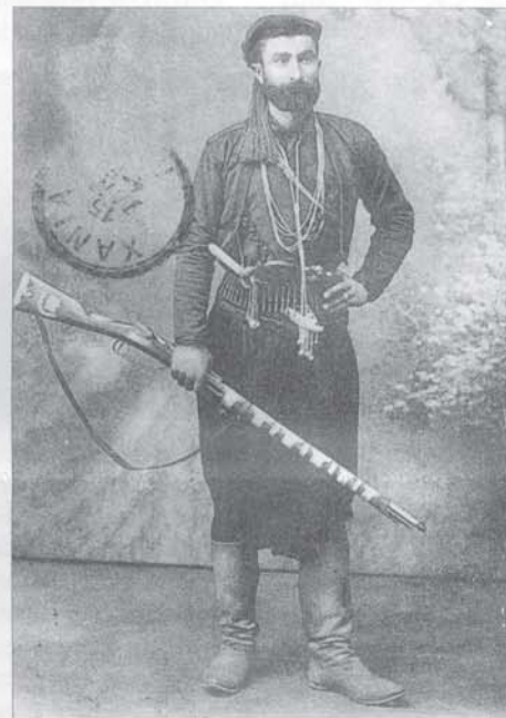
Ο Λεωνίδας Παπαμαλέκος

ΚΑΤΑ ΤΗ ΓΕΝΙΚΗ ΣΥΝΕΛΕΥΣΗ της Ομοσπονδίας των Αποκορωνιώτικων πολιτιστικών Συλλόγων της Αττικής που πραγματοποιήθηκε στις 8 Φλεβάρη στην Αθήνα, σε πνεύμα ομόνοιας και αγάπης, εγκρίθηκαν τα πεπραγμένα και αποφασίσθηκε να ανατεθεί σε γλύπτη κρητικής καταγωγής η φιλοτέχνηση της προτομής του Μακεδονομάχου σπλαρχηγού από το Βάμο Λεωνίδα Παπαμαλέκου και να τοποθετηθεί αυτή στο χώρο που παραχώρησε ο Δήμος Σιάτιστας Κοζάνης, όπου και ο τόπος της θυσίας του.