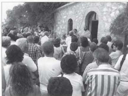
Στον Άγιο Αντώνη.

ΠΟΤΕ ΠΕΡΑΣΕ Ο ΧΡΟΝΟΣ , από πέρυσι το καλοκαίρι, που τα ξαναλέγαμε τα καλοκαιρινά μας; Μου φαίνεται ότι οι περισσότεροι δεν το καταλάβαμε. Τέλος πάντων, χρόνος είναι αυτός, περνάει δίπλα μας (;) και λογαριασμό δεν δίνει. Ο πολύς ο κόσμος αντιλαμβάνεται μόνο τα καλά, τις δοκιμασίες και τις αλλαγές που μας φέρνει. Εγώ, π.χ., γυρνώντας τέλος του Αυγούστου στην Αθήνα, και εξετάζοντας τη φιγούρα μου στον καθρέπτη, διαπίστωσα ότι η φαλακρίτσα μου προχώρησε προς τα πίσω, ενώ αντιθέτως η κοιλίτσα μου προχώρησε προς τα μπρος! Χαλάλι, όμως. Πέρασα ένα πολύ ευχάριστο καλοκαίρι, παρά τα αναπόφευκτα τρεξίματα πάνω κάτω, με τις κάποιες δουλειές και υποχρεώσεις που είχα.