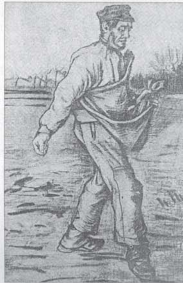
Ο ΣΠΟΡΕΑΣ. Βαν Γκογκ (1853-1890)