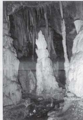
Ο Χαϊνόσπηλιος φωτο με σταλαγμίτες

Χανιά 12-1-2007 Προς το Σύλλογο Αρμενιανών Χανίων