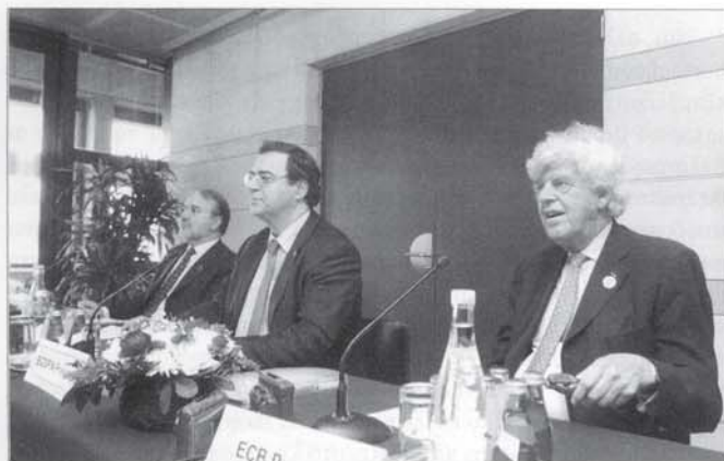
Στη σύνοδο των οκτώ ισχυρότερων χωρών του κόσμου G8, ως πρόεδρος της Ευρωπαϊκής Ένωσης.

Πάντα είχα σχέση με την πολιτική. Μετά το Πολυτεχνείο ήμουν Πρόεδρος των φοιτητών, αλλά και όταν ήμουν στην Αγγλία είχα γίνει μέλος του Εργατικού Κόμματος και συμμετείχα στις προσπάθειες αντιπαράθεσης με την πολιτική της Θάτσερ. Αργότερα η ενασχόλησή μου με τα οικονομικά με έφερε ακόμα πιο κοντά σε κεντρικές πολιτικές επιλογές που αφορούσαν τη χώρα, κυρίως την ανάγκη να συγκλίνει με την Ευρωπαϊκή Ένωση και να μπορέσει να συμμετάσχει στο Ευρώ. Αυτό ήταν και αντικείμενο της επιστημονικής μου δραστηριότητας και ήταν πολύ φυσικό να ανταποκριθώ