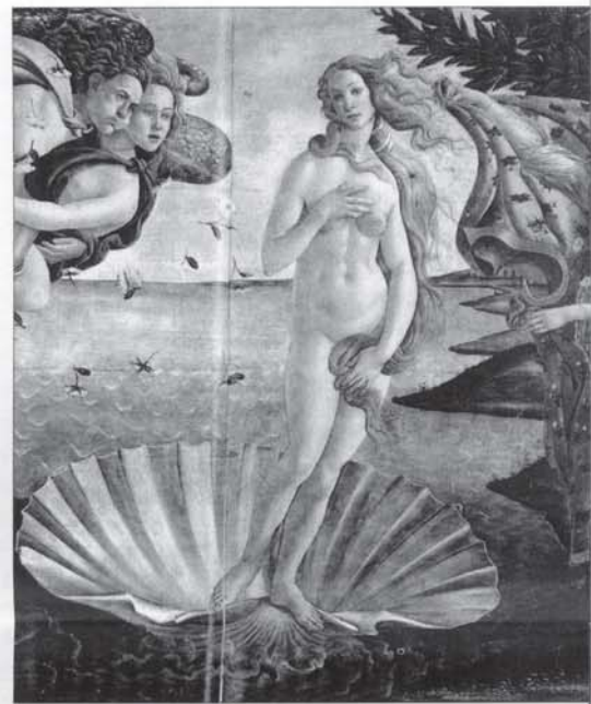
Μια, σαν ετούτη, φτάγδυμη, είχανε ζωγραφισμένη στην εμπασιά του ξενοδοχείου, μα δεν την είδε η γρα, ζαβακωμένη ως ήταν από το ταιλιπόδεσμα του ταξιδιού... Πρόκειται, βέβαια, για λεπτομέρεια από το αριστούργημα του Μποτιτσέλλι «Η γέννηση της Αφροδίτης» (γύρω στα 1480-1485)

-Γιάντα, εκαταργησέτέ τα, μπρέ τα ξερατά; -Τα καράβια, μπάρμπα, τα σημερνά, ετσά θεόρατα που'ναι, έχουνε μηχανές θεριά, που δεν τ'αφήνουν να ταλαποδέρουν δεξιά-ξερβά, να νταραγκουνούν τον κόσμο ν'ανακερώνεται, σαν τα γοργαλιδικά μεγίρια, που καβαλίκευε στα νιάτα σου τη γυναίκα και την επήγαινε στα πανηγύρια. Να σου δώω όμως ένα καμεράκι,