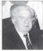
Γράφει ο Γιάννης Κ. Λεντάρης