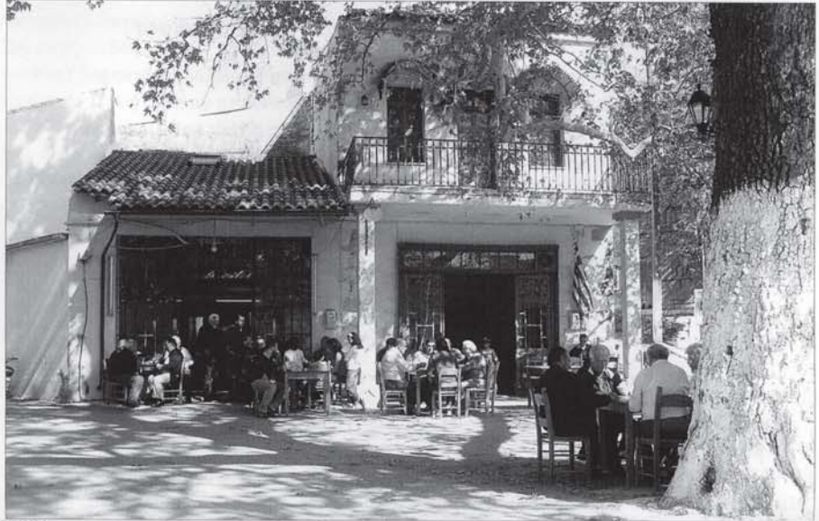
Εικόνες από την πλατεία του χωριού μας τη δεύτερη Κυριακή των εκλογών. Κάθε ομοιότητα του διπλανού κειμένου με τις φωτογραφίες είναι τυχαία.

- Γιάντα μωρέ παλιοκερατά επήγες και μου πήρες τον πεθερό από το σπίτι; Εγώ κοροΐδο είμαι που τονέ ταΐζω και τονε ποτίζω τόσα χρόνια; Κι εσύ ο έξυπνος να τονε βάνεις να ψηφίζει όπου